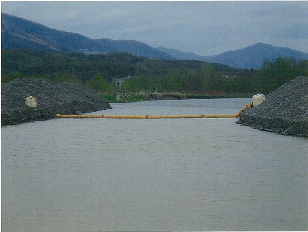
シルトフェンス 概略構造図